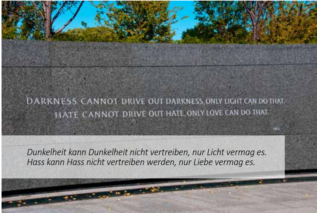
Martin Luther King Jr. Memorial, Washington, DC

Einer trage des andern Last, so werdet ihr das Gesetz Christi erfüllen.